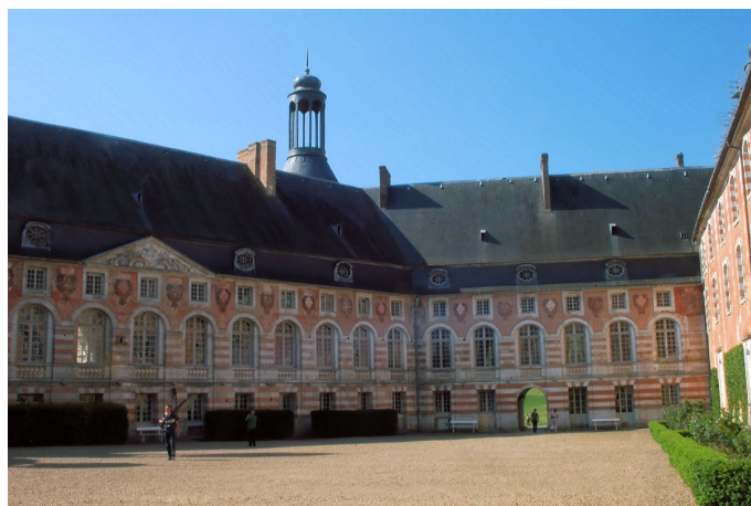
Cour intérieure du château de Saint-Fargeau Bel exemple du style classique français